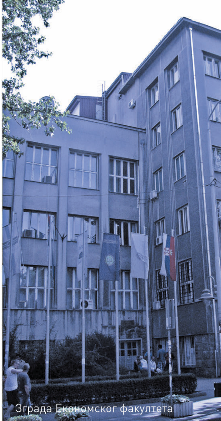
Зграда Економског факултета