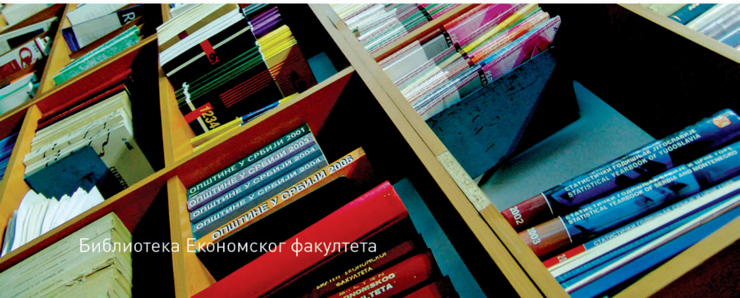
Библиотека Економског факултета

Диплома Економског факултета у Нишу је призната како у земљи, тако и у иностранству. Знања и вештине стечене током студија, омогућили су студентима Економског факултета Универзитета у Нишу наставак усавршавања у многим земљама широм света: Канади, САД, Аустралији, Француској, Италији, Великој Британији, Аустрији, итд. Такође, студенти имају директну проходност на мастер студије на факултетима у Нансију и Клермон Ферану (Француска), Нотингему (Велика Британија), Венецији (Италија), Бечу (Аустрија), Љубљани (Словенија) итд.